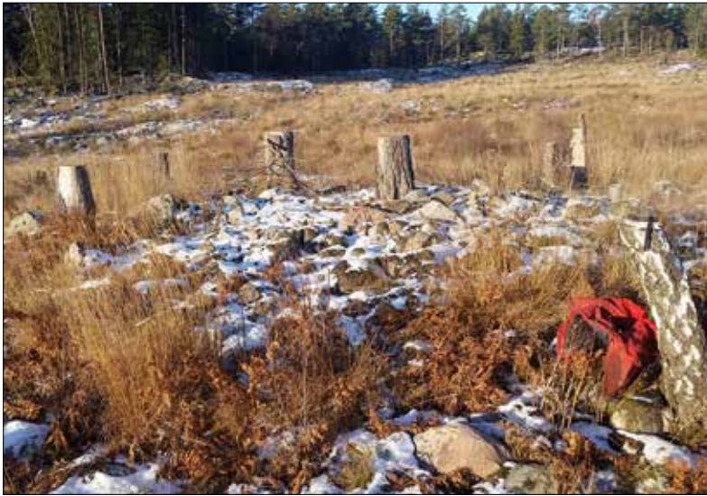
Fornlämning Västerljung 64:1 efter det att tall- och granplantor tagits bort. Bilden är tagen från sydöst. Foto: Ingeborg Svensson 2016, Sörmlands Arkeologi AB.