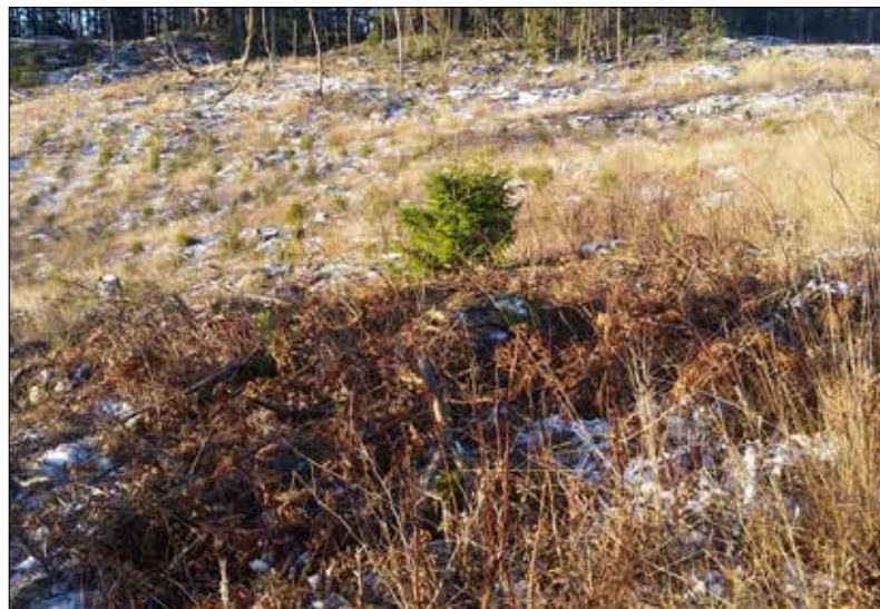
Riset togs bort och spreds ut på behörigt avstånd från stensättningen av markägare Arne Karlsson. Bilden är tagen från söder.