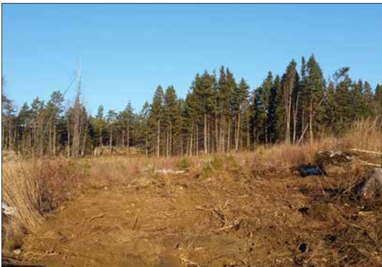
Hjulspåren efter återställning. Bilden är tagen från söder.