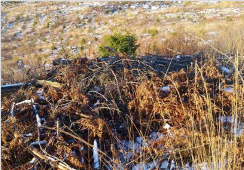
Rishögen som låg väster om stensättningen Västerljung 64:1. Bilden är tagen från söder.