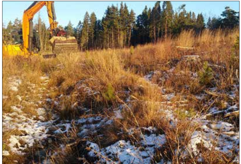
Hjulspåren öster om fornlämning Västerljung 64:1. Bilden är tagen från söder.