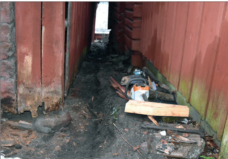
Del av schakt 4. Till vänster det aktuella uthuset, till höger ett intilliggande uthus beläget inom Bispén 3. Foto mot öster: Lars Norberg 2019, Sörmlands Arkeologi AB.