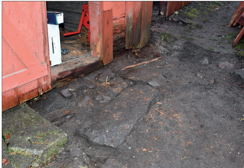
Del av schakt 3 med nypåträffat fundament till en trappsten. Foto mot väster: Lars Norberg 2019, Sörmlands Arkeologi AB.