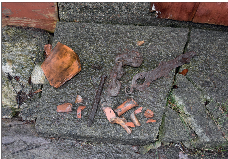
Fynd från schakten på norra sidan. Tegelpanna, djurben, yngre rödgods och järnföremål.