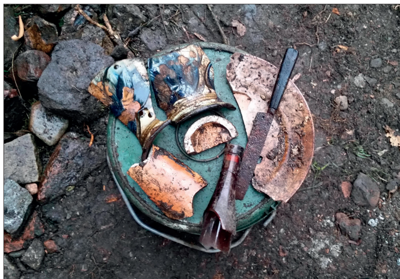
Urval av föremål från schakt 4. Porslin, fajans, seltserkrus av stengods, bordskniv med skaft av bakelit och del av en glasbutelj.