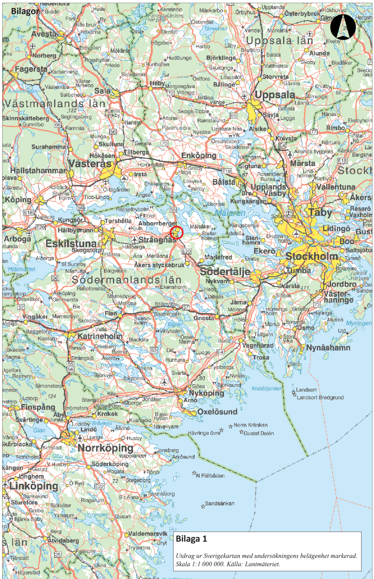
Bilaga 1 Utdrag ur Sverigekartan med undersöknings belägenhet markerad. Skala 1:1 000 000.