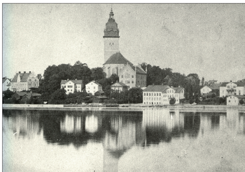
Utsikt mot Strängnäs från Sundby efter biskopsgårdens restaurering. Grubbska gården och de aktuella uthusen syns till vänster i bild. cirka år 1890 (SLM SEM_B326-10R).