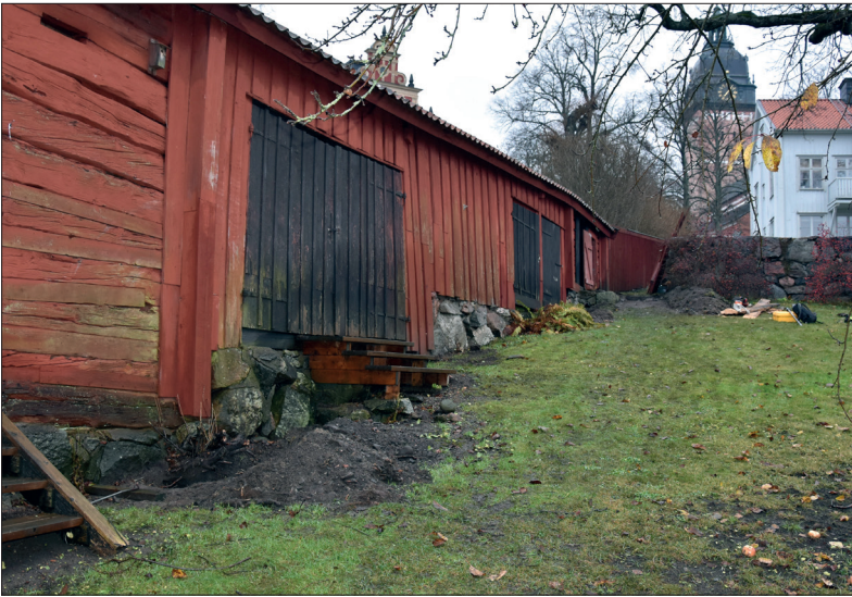
Översikt över uthusets norra långsida. I förgrunden syns schakt 1. I bakgrunden skymtar Grubbska huset och domkyrkan.