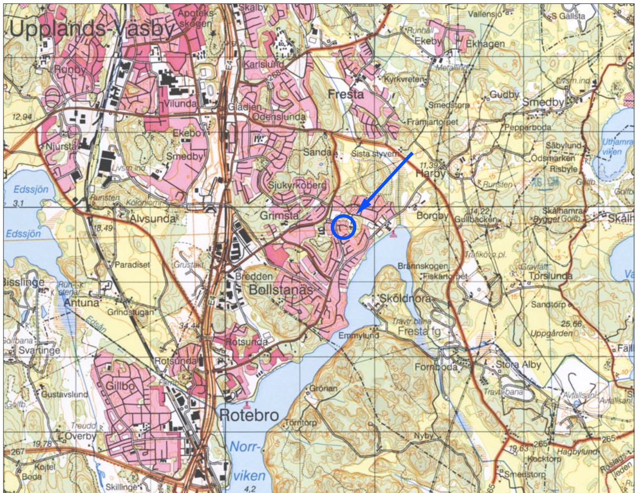
Fig. 1. Förundersökningsområdet markerat på utdrag ur Topografiska kartans blad 10I NV och 11I SV. Skala 1:50 000.