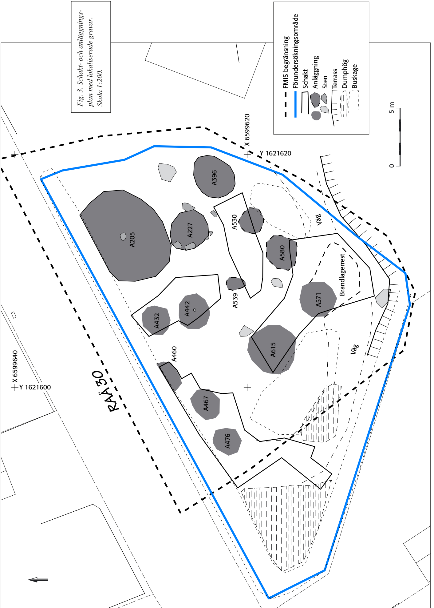
Fig. 3. Schakt- och anläggningsplan med lokaliserade gravar. Skala 1:200.