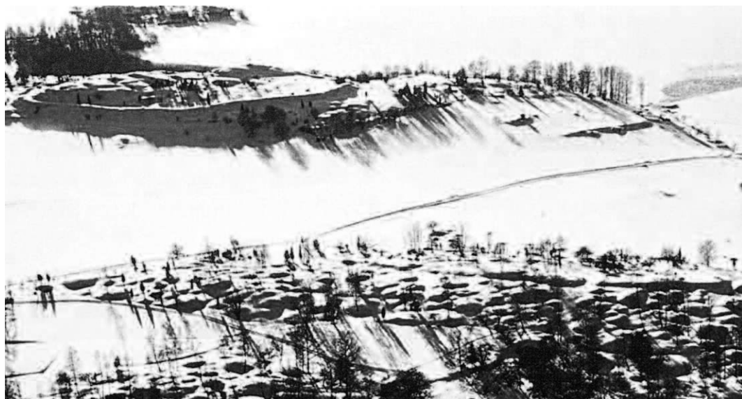
Fig. 1. Birka från nordöst med stadsvallen och Hemlanden i förgrunden. Borgberget och borgvallen avtecknar sig i övre vänstra hörnet, med portöppningen till höger. På den naturliga slänten nedanför Kungsporten finns det kristna gravfält som Anne-Sofie Gräslund identifierat. Foto Jan Norrman 1986, Riksantikvarieämbetet, efter Ambrosiani 2002, s. 20. —Birka from the north-east with the town rampart in the foreground. The hillfort is seen top left.

vill få köpmännen att reagera. Han säger till dem att civitas och vicus kommer att brännas. Det verkar som om dessa båda utgör delar av staden, urbs , menar Ambrosiani (2005, s. 26).