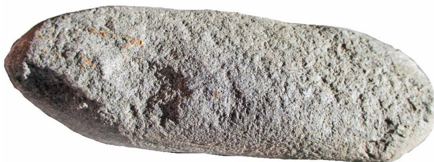
nr 47 ÄMNE TILL YXA