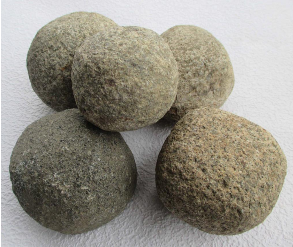
Några av löparna från S 2.