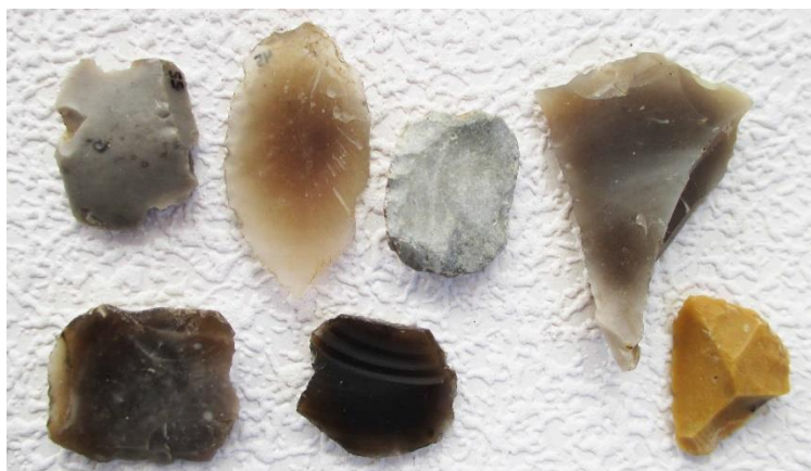
AVSLAG OCH SKRAPOR AV FLINTA.