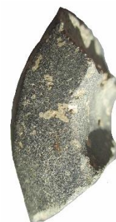
nr 266 YXFRAGMENT