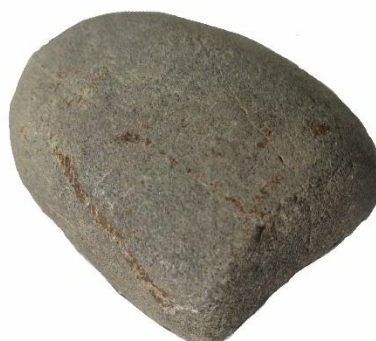
Nr 133 GLÄTTSTEN