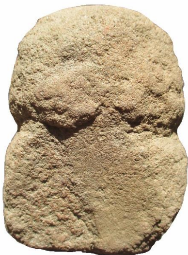
Nr 124 KLUBBA