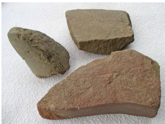
Slipstenar av tre typer på S 3.