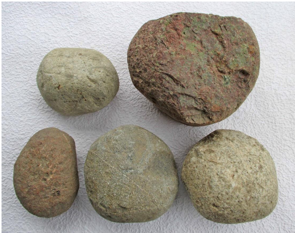
Fem av knackstenarna från S 2.