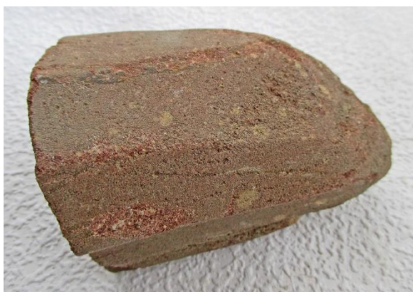
Fasetterad slipsten nr 23