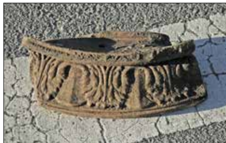
Figur 6 (t h). Ett oglaserat kakelugnskakel från lager 200.