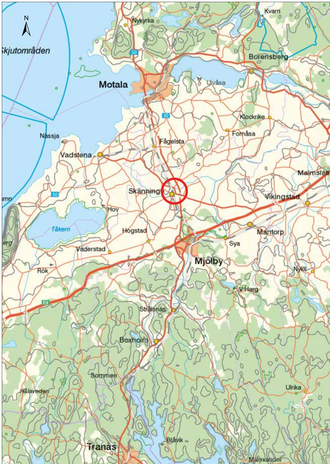
Figur 1. Läget för undersökningen markerat på utsnitt ur GSD-Sverigekartan, © Lantmäteriet Topowebb. Skala 1:300 000.