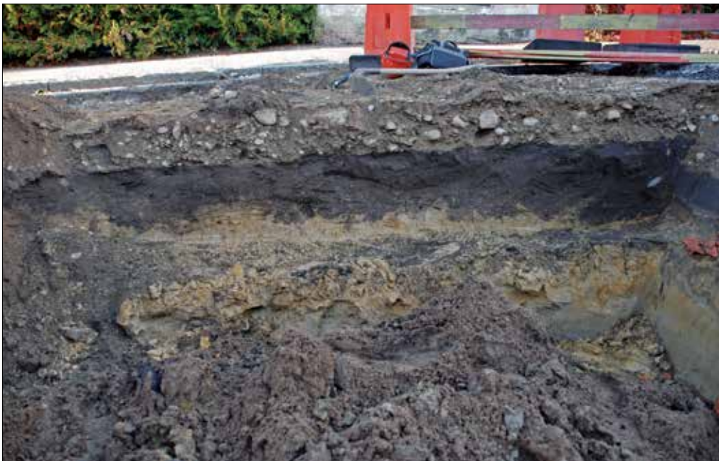
Figur 5 (ovan). Det östra schaktets norra sektion. Ojämnheterna i det mörka lagrets kontaktyta mot den gula undergrunden indikerar att marken odlats, L210.