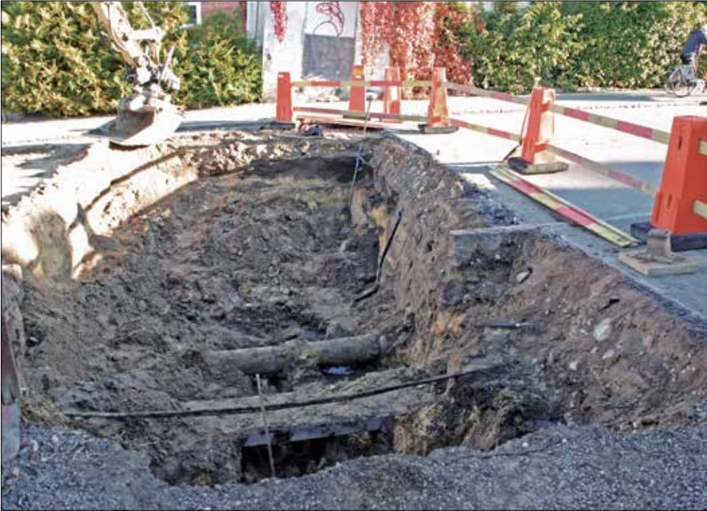
Figur 4. Det östra schaktet genom Borggatan, sett från söder. I schaktets nedre högra hörn påträffades kulturlagret L200, som innehöll kakelugnsfragment med mera.