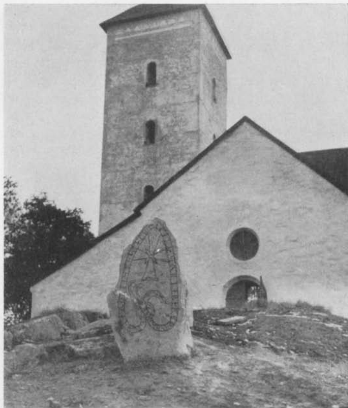
Fig. 8. Den lagade och resta runstenen U 297. Det nyfunna fragmentet befinner sig inom den ritade cirkeln. Foto N. Lagergren 1953. — Runic stone U 297 repaired and set up. The newly discovered fragment is shown in the circle.

det högt uppe i tornmuren nu påträffade fragmentet. Inskriften på U 297 lyder i sin helhet: