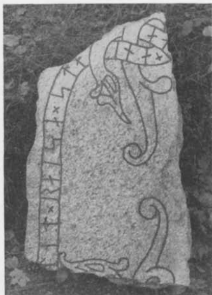
Fig. 9. Nyfunnet runstensfragment från Skånela kyrka. Foto N. Lagergren 1953. — Fragment of a recently discovered runic stone from Skånela Church.