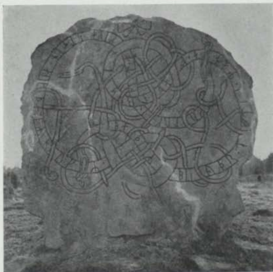
Fig. 13. U 304 Bensta, Skånela socken. Foto T. Norman 1953. — U 304 Bensta, Skånela parish.

styrkt från den nu oåtkomliga Botkyrkastenen (Sö 282). Om Benstastenen hukR uppfattas som HaukR måste man räkna med att en a -runa har utelämnats; jfr hku a för haku a.