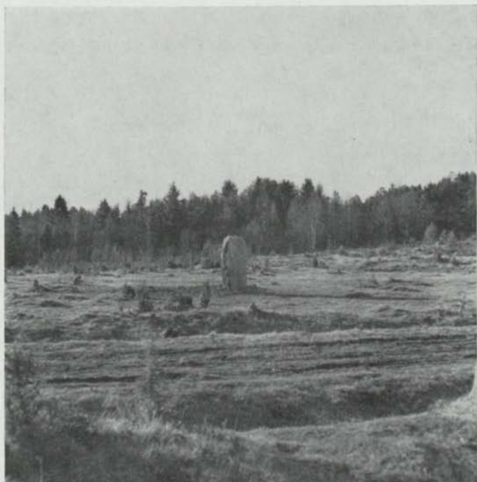
Fig. 12. Benastenen rest på sin ursprungliga plats. Foto T. Norman 1953. — The Bensta stone set up on its original site.

den 20 mars 1953, varefter stenen lagades och restes (R. Wibeck). Stenen visade sig vara en sedan 1600-talet försvunnen runsten (U 304), som jag vid flera tillfällen förgäves hade sökt. Den var okänd i bygden.