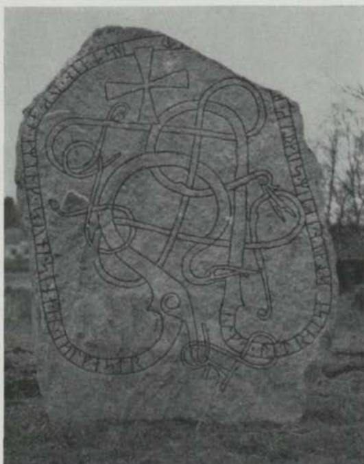
Fig. 1. Kummelbystenen, Helenelund, Sollentuna. Foto T. Norman 1953. — The Kummelby stone, Helenelund, Sollentuna.

Runstenen flyttades omkring 45 m åt Ö och restes 7 m SSÖ om gamla infartsvägen till Kummelby, 11 m VSV om stora landsvägen, från vilken den nu gör ett ganska ståtligt intryck; se fig. 1.