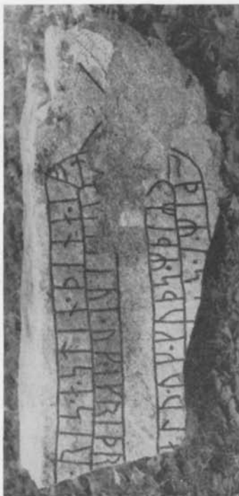
Fig. 10. Den återfunna runstenen U 302. Foto N. Lagergren 1953. — The rediscovered runic stone U 302.

De båda i Skånela torn nu upptäckta fragmenten torde snarast vara ristade omkring mitten av 1000-talet; de lägga sålunda enligt min mening inga hinder i vägen för en tidig datering av den ålderdomliga och intressanta kyrkans torn.