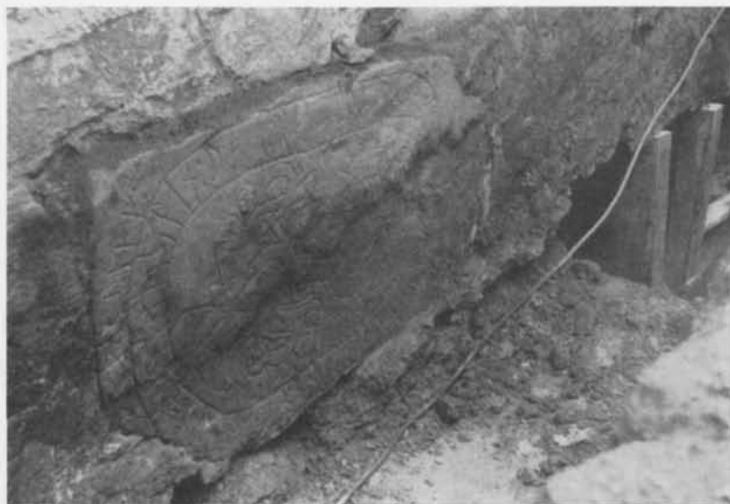
Fig. 2. Spångastenen på sin plats i kyrkgrunden. Foto N. Lagergren 1953. — The Spånga stone built into the foundation of the church.

Två tydliga fall av h -bortfall kunna iakttagas: elka och emink . Det förra återger givetvis kvinnonamnet Hæлга , känt från åtta andra svenska runinskrifter. Den nu funna stenen ger oss det fjärde uppländska belägget; namnet är således icke vanligt på de uppländska runstenarna. Skrivningen emink (ack.) återger mansnamnet Hæmingr (nom.), tidigare känt från ett 15-tal runinskrifter. Namnet har tydligen varit ganska vanligt i Uppland under vikingatiden. Det förekommer f. ö. i flera närbelägna runristningar — S. Sätra, Sollentuna socken (U 101), Antuna, Ed socken (U 107), Älvsunda, Ed socken (U 118), Hagby, Täby socken (U 143 och 148), Löttinge, Täby socken (U 159) samt Fresta kyrka (U 256). Tre av dessa belägg (U 101, 143 och 148) åsyfta Häming Ingefastsson, Jarlabankes äldre bror. Den Häming Svärtingsson, som förekommer på den nyfunna stenen, är icke identisk med någon Häming, nämnd i grannsocknarnas inskrifter.