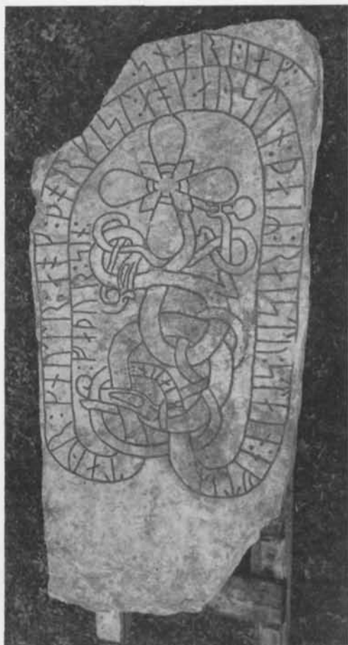
Fig. 3. Spångastenen framtagen och uppmålad. — The Spånga stone removed and painted.

Till läsningen: Inskriften börjar utan skiljetecken. I 1 t utgå bistavarna från ramlinjen, ovanligt långt från huvudstavens topp. 3 y är tydligt stunget. 11 o har, i likhet med 14 o och 21 o , dubbelsidiga, snett ned åt höger gående bistavar. 13 þ har förlorat toppen i en djup kantflagring. 16 k är ej stunget, ej heller 17 i . 24 y är tydligt stunget. 38 u har förlorat toppen. 44 e är tydligt stunget. 47 i har förlorat ett kort stycke nedtill, och 48 R har förlorat vänstra bistavens nedre del. Skiljetecken finnas både efter 53 n och framför 54 f , som inleder den fristående runföljden 54 f —61 n . På samma sätt finnas skiljetecken såväl efter 61 n som före 62 s ; runföljden 62 s —69 g står nämligen i en särskild slinga upptill på stenen. Skiljetecknet före 62 s har förlorat övre punkten genom en kantskada. 69 g är tydligt stunget. Inskriften slutar utan skiljetecken.