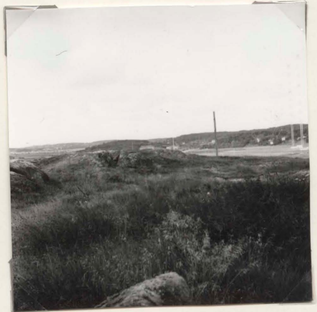
neg.nr (X10: 7170) B 2390

1. Översikt över Högsboområdet med anl. 23:857 och 23:858 markerade, från berget med 23:866, fr. NO.