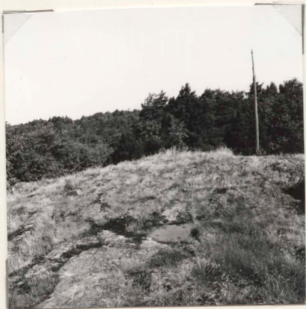
neg.nr (X10: 7171) B 2391

2. Översikt av krönet med anläggningen från NO.