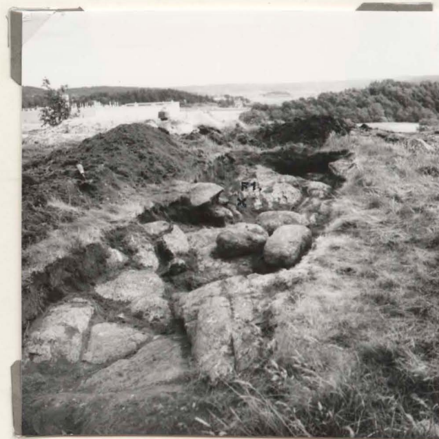
neg.nr (X10: 7172) B 2392

3. Anläggningen före påbörjad undersökning, från SV.