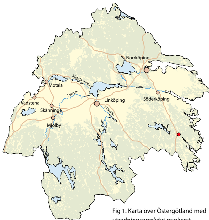
Fig 1. Karta över Östergötland med utredningsområdet markerat.