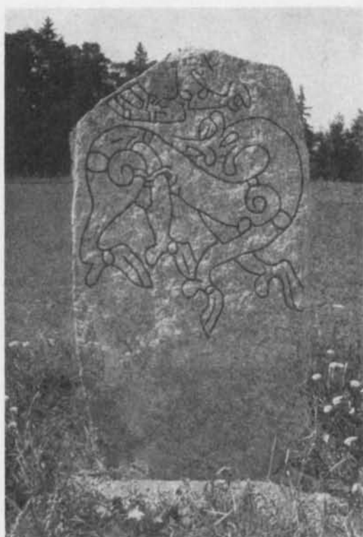
Fig. 5. Rybylundstenen, Kungs-Husby socken. Foto förf. 1955. — The Rybylund stone, Kungs-Husby parish.