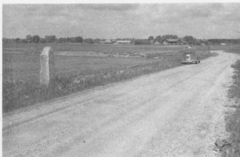
Fig. 3. Rybylundstenen rest på fyndplatsen. I bakgrunden till höger synes bron. 1955. — The Rybylund stone erected on its original site. The bridge can be seen in the background (right).