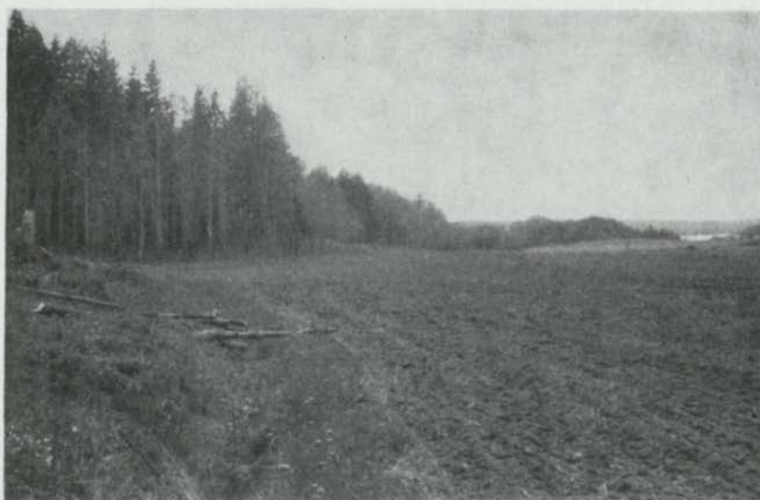
Fig. 1. Billbystenen rest i södra kanten av den åker där den påträffades. Runstenen synes längst till vänster. Foto förf. 1955. — The Billby stone set up at the south edge of the field in which it was found. The rune-stone will be seen at the far left of the picture.

Stenarten är grå granit. Stenens hela höjd är 1,50 m; höjden över marken är 1,30 m. Bredden är nedtill 0,90 m, tjockleken vid rotändan 0,35 m.