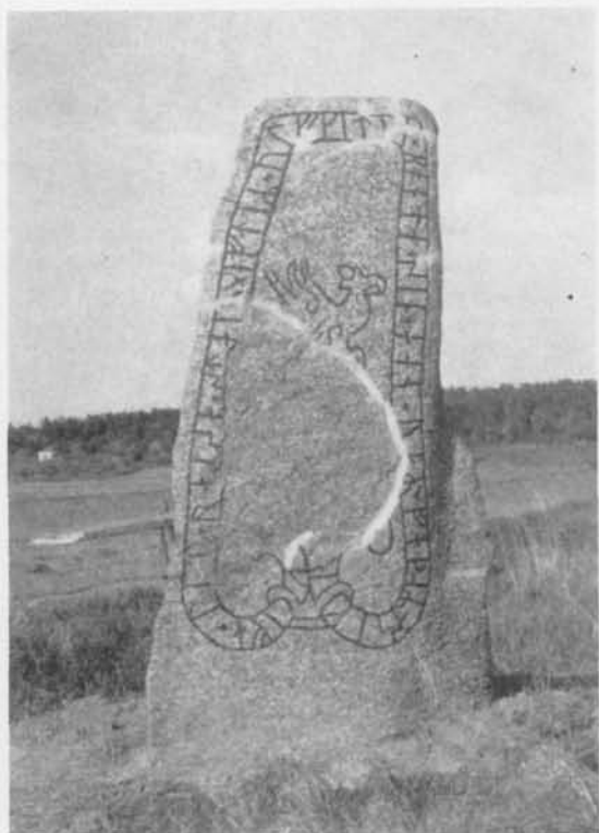
Fig. 10. Brobysten. Foto förf. 1955. — The Broby stone.

Ett fornvårdsarbete, som förtjänar att nämnas i detta sammanhang, har under sommaren utförts i Kalmar socken. Brobysten (U 633), som på 1880-talet utan tillstånd fördes bort från sin gamla plats och restes vid stora landsvägen Stockholm—Enköping, föll i januari 1955 omkull. På grund av riksvägens ombyggnad hade denna stenens sekundära plats nu blivit ur alla synpunkter olämplig. Eftersom man för ovanlighetens skull kunde exakt bestämma, var stenen tidigare hade stått, fördes runstenen, med hjälp av intresserade ordsbor, den långa vägen tillbaka till den ursprungliga platsen och restes där. Den står nu åter vid Broby bro, d. v. s. vid den lilla bro, som ligger omkr. 300 meter