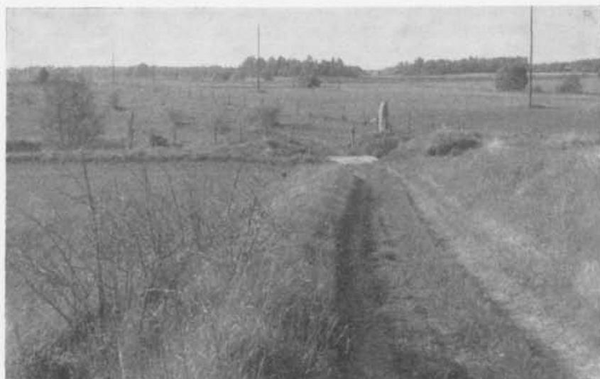
Fig. 11. U 633 Broby, Kalmar socken. Runstenen återförd till sin ursprungliga plats vid Broby bro. Foto förf. 1955. — U 633 Broby, Kalmar parish. The rune-stone restored to its original site by Broby bridge.

NV om Viby, på bäckens norra sida, ett par meter öster om den gamla vägen mellan Viby och Broby (fig. 10 och 11). Av Broby återstår numera endast några obetydliga husgrunder. Rest på sitt gamla rum kommer runstenen till sin rätt på ett helt annat sätt än den gjorde på den plats dit den obetänksamt för 70 år sedan flyttades.