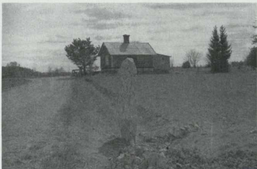
Fig. 4. Rybylundstenen. Bilden tagen från N. 1955. — The Rybylund stone taken from the north.

Inskriftens personnamn äro alla kända från andra uppländska runinskrifter. Faderns namn Guðrik har tydligen varit sällsynt. Det var hittills endast belagt i fyra runinskrifter, nämligen U 1 29 Hillersjö, Hilleshögs socken (belägget skadat), U 355 Lunda kyrka, U 649 Övergarns kyrka och U 1110 Broddbo, Skuttunge socken. Den nyfunna stenen ger oss sålunda det femte exemplet på mansnamnet, vars samtliga belägg sålunda äro från Uppland. I Lundgrens och Brates namnordbok upptages endast ett säkert exempel på namnet från medeltiden; också detta belägg är från Uppland ( Gudricus , år 1316). Från Norge och Island äro några få fall kända.