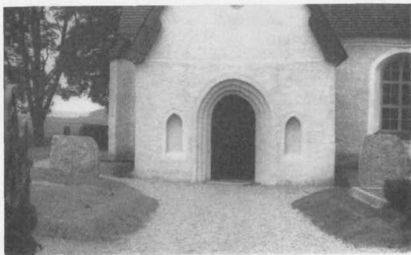
Fig. 6. De två runstenarna resta framför Långtora kyrkas vapenhus. Den vid restaureringen funna stenen står till höger. 1955. — The two rune-stones erected in front of the porch of Långtora Church. The right stone is the one found during restoration of the church.

Ovanför det kraftiga djuret i runstensstil ser man en figur, som knappast kan föreställa något annat än en flygande fågel (fig. 5). Detaljerna äro emellertid särskilt upptill på ristningsytan svåra att reda, eftersom graniten där är hårt vittrad och ojämn.