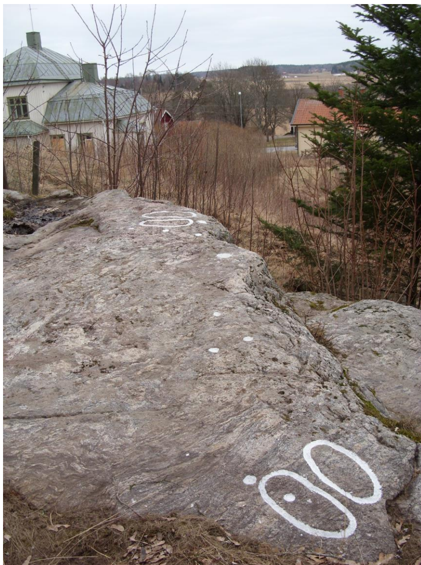
Fotsulehällen från norr

Rapport över inventering och dokumentation