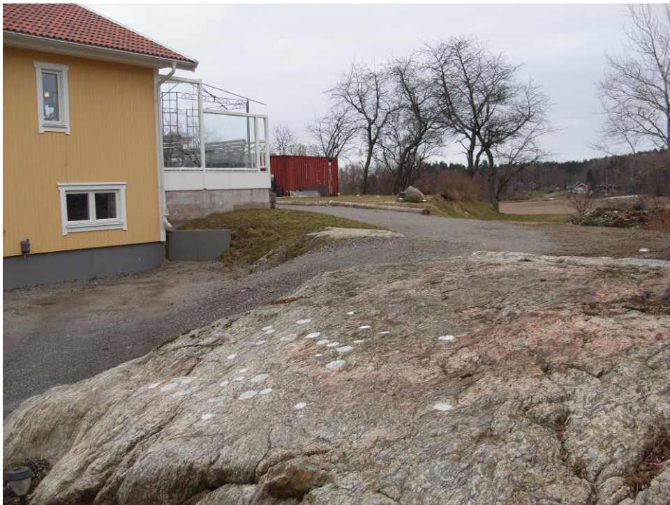
Nyfynd 93 – 95 foto från nordost