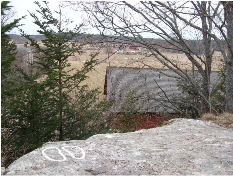
Fotsulehällen från öster