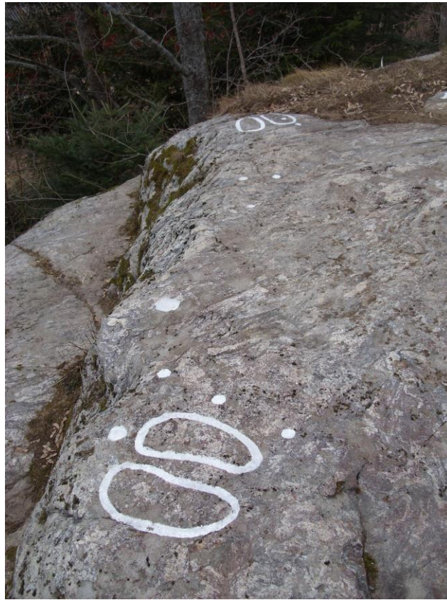
Fotsulehällen från sydost

Nyfynd vid Sorunda klockstapel i Sorunda s:n