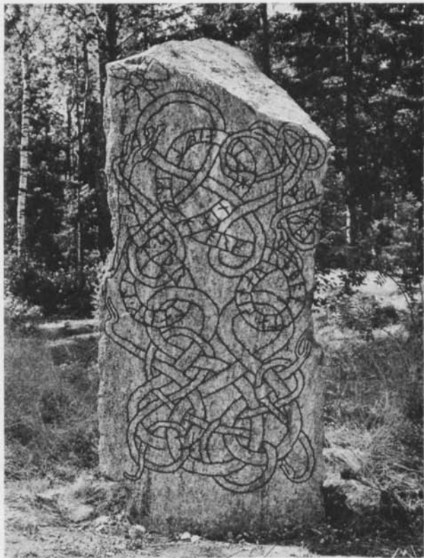
Fig. 3. U 294 Lilla Vilunda, Foto Runverket, Gabriel Hildebrand 1972.

sn, U 409 Lövestaholm, S:t Olovs sn, U 829 Furby, Giresta sn, U 939 Uppsala och Danmarks Runeindskrifter n:r 345 Simrishamn.