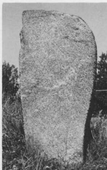
Fig. 5. Bautastenen i gravfältet vid Lilla Vilunda. 1972. — The monumental stone in the gravefield at Lilla Vilunda.

reslig bautasten, avsevärt högre än runstenen, i ett uppländskt gravfält från vikingatiden. (Bautastenen är resligare än vad som uppges i ämbetets fornminnesinventering; den mäter 177 cm, runstenen 156 cm.) Stenen står rest endast 45 m N om U 293.