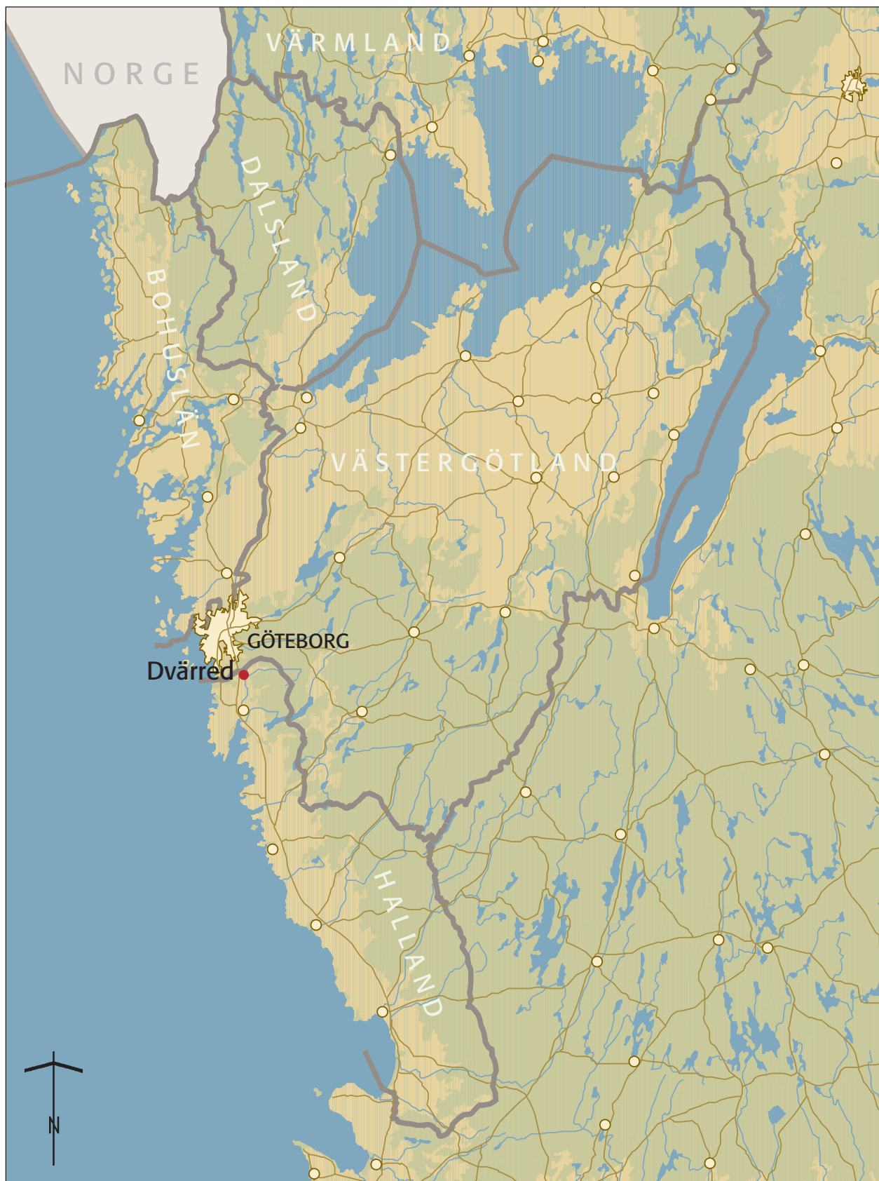
Fig. 1. Utsnitt ur GSD-Sverigekartan med platsen för undersökningen markerad.