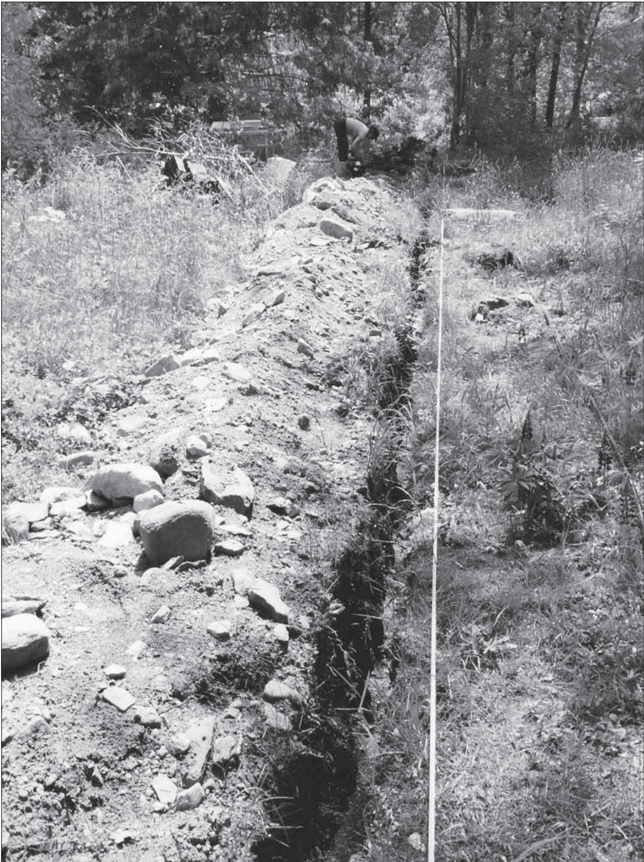
Fig. 4. Lokalen från väster.