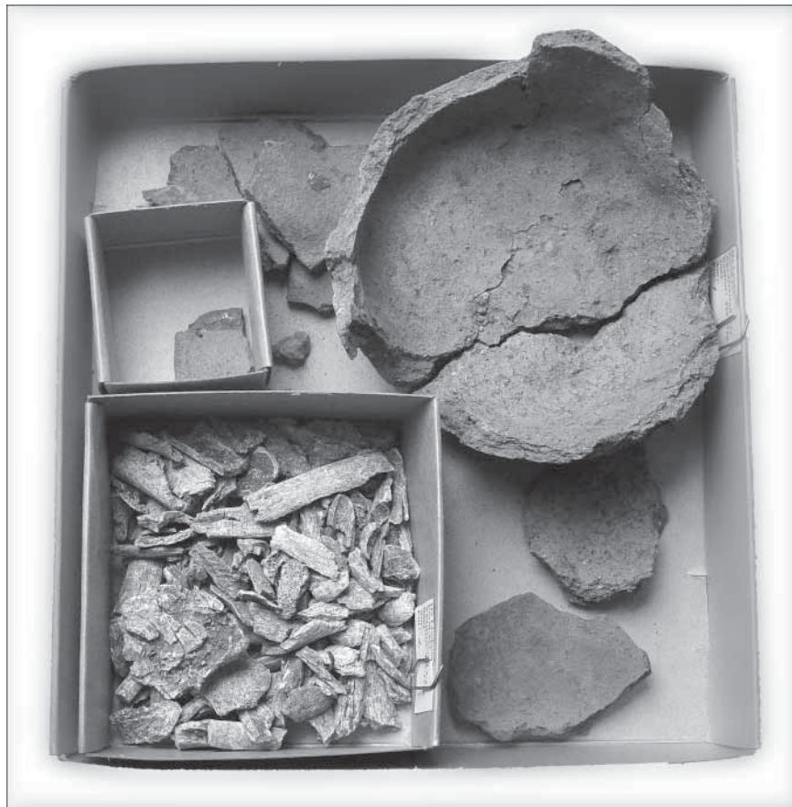
Fig. 6. Keramik och brända ben som inlämnades av Björn Albins-son, Dvärred.

Vid kontrollen av vattenledningsschaktet påträffades keramik från minst två keramikkräslor liksom brända ben, två metallföremål, kol och en mindre mängd recenta fynd. De senare låg i ett humusinblandat lager i schaktets södra del.