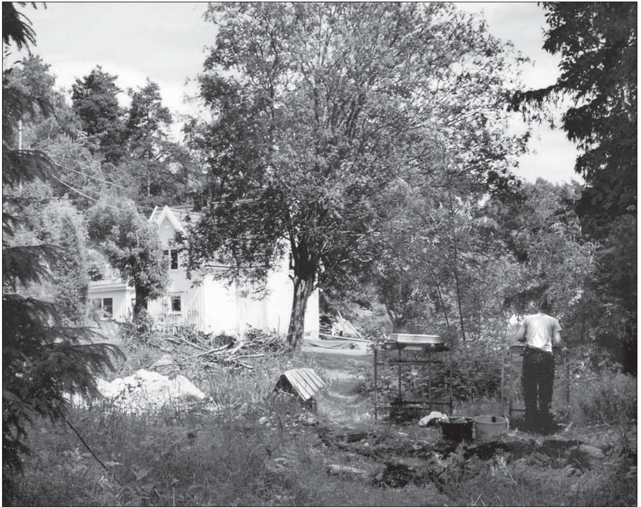
Fig. 5. Vattenledningsschaktet från söder.

Fyndmängden var störst i schaktets södra del, där de samlades i påsar med angivande i meter var längs schaktet det fanns. Vid ett stenblock (0,7×0,55+0,25 meter) vid 12,0–12,5 meter av schaktet påträffades en särskilt stor koncentration av keramik (F20–21). Från och med 14 meter, då fyndmängden starkt minskat, prövades att samla per två meter. I de nordligaste delarna av schaktet påträffades inga fynd alls.