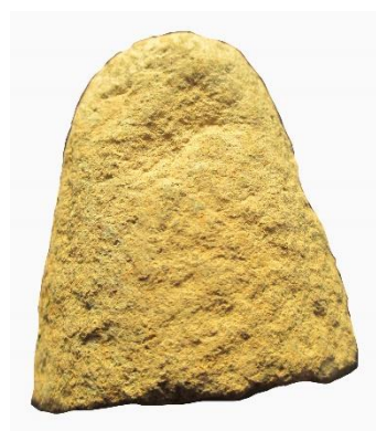
nackparti av trindyxa.