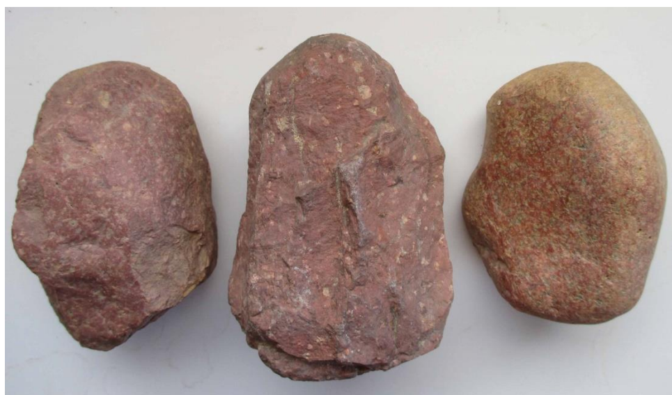
Tre av knackstenarna, alla med en knackyta, uppåt på bilden.