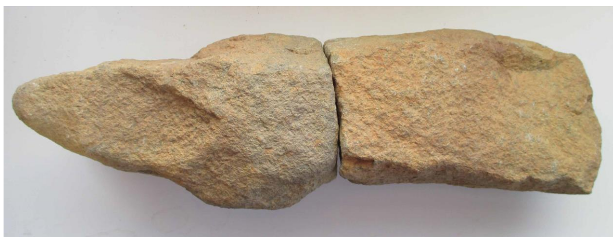
Det 25 cm långa förarbetet till en grönstensyx.