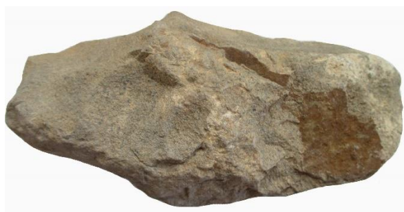
Det mindre förarbetet till yxa