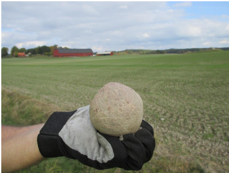
Löparsten objekt 5 med fyndplatsen på åkern i bakgrunden.