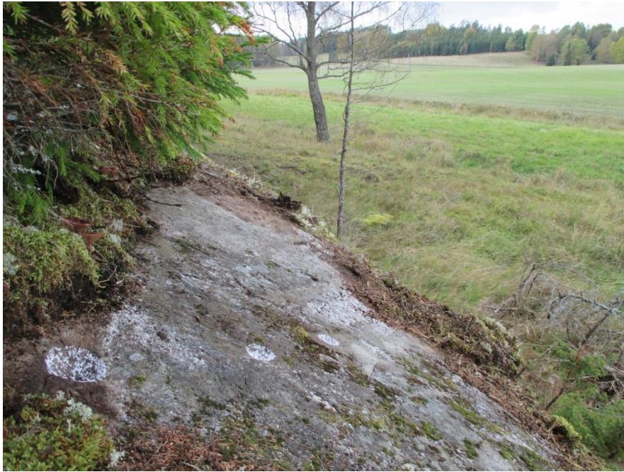
Objekt 4 foto från öster